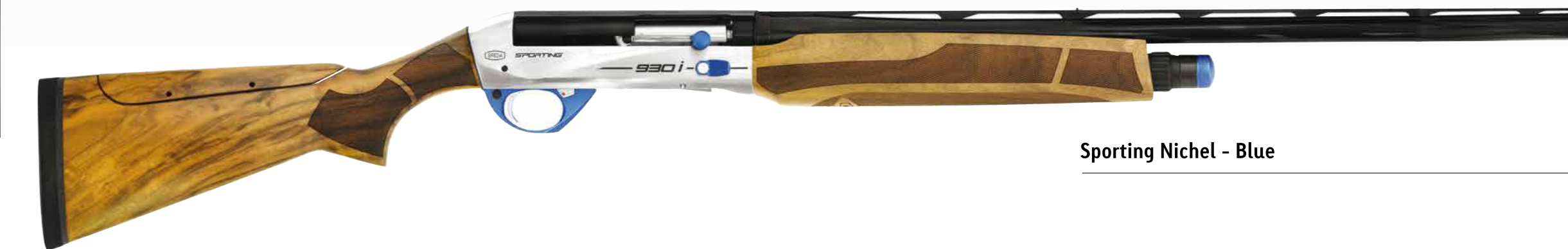
Sporting Nickel - Blue

930i Nickel represents the higher level made into Sporting world by Breda. Design by Pro Shooter it gains top quality solutions for users; in Nickel version it gains as well also precious cosmetics solution as better walnutstocks and precious polish processes. The Extreme Nickel deposit process reveals the quality of surface polished by hand by Italian artisans; the anodized accessories are made with a special aluminum according to the anodizing process.