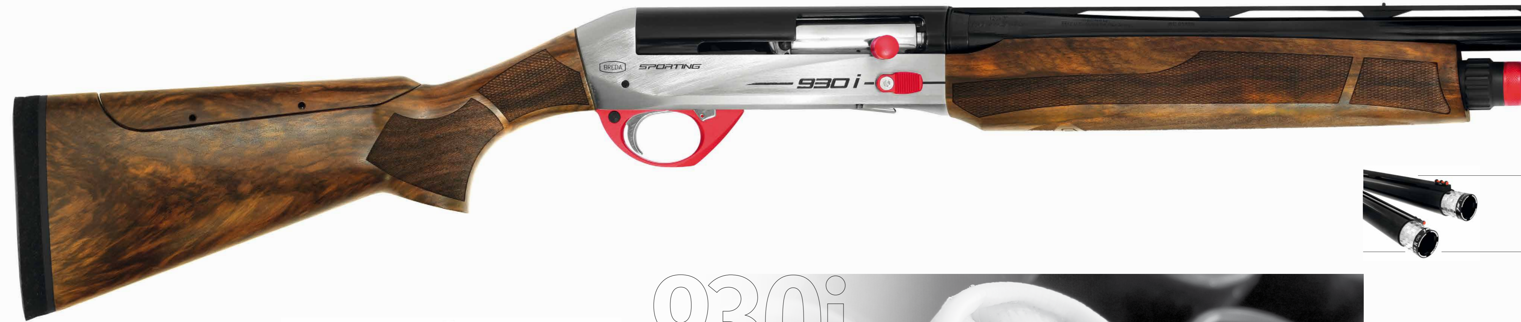
Sporting Nickel - Red